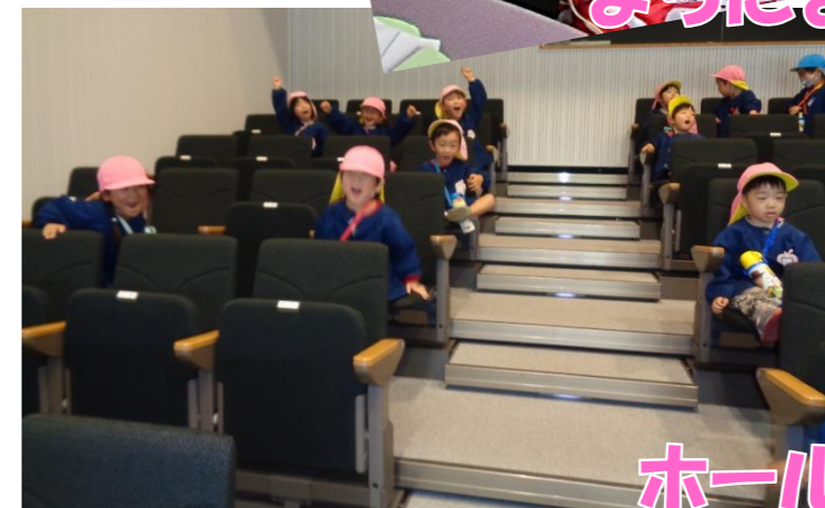
「ホールの椅子いいね！」