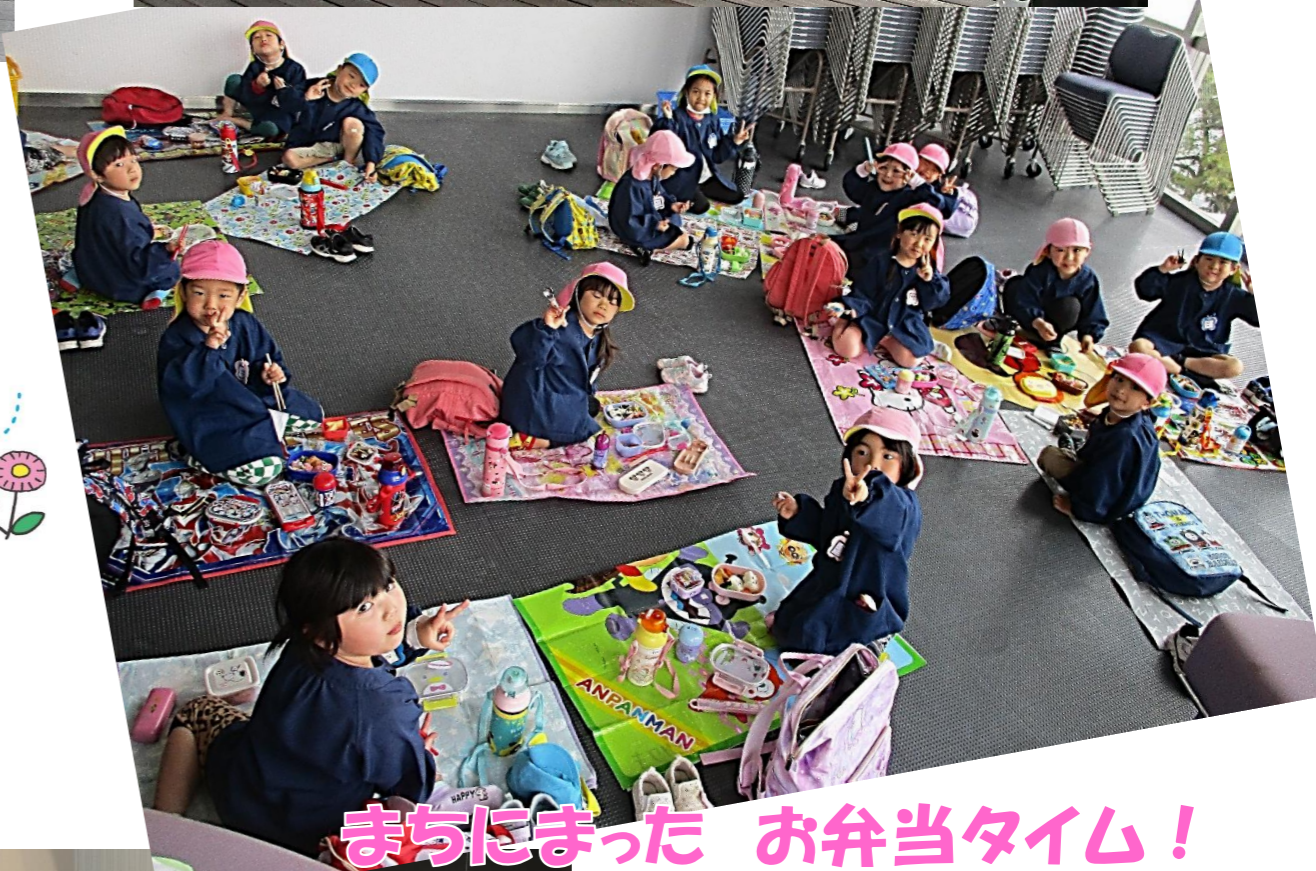
「まちにまた お弁当タイム！」